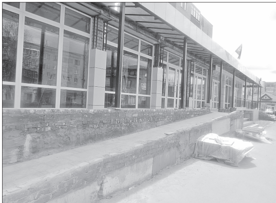
Некоторые предприниматели заботятся о доступной среде еще на этапах строительства и реконструкции