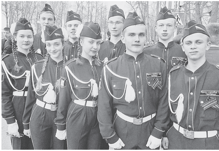
Победители городской «Зарницы» — команда 8-й школы